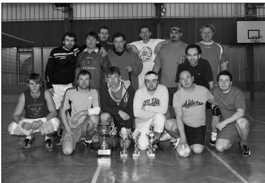
27. 12. se uskutečnil 2. ročník vánočního pětiboje