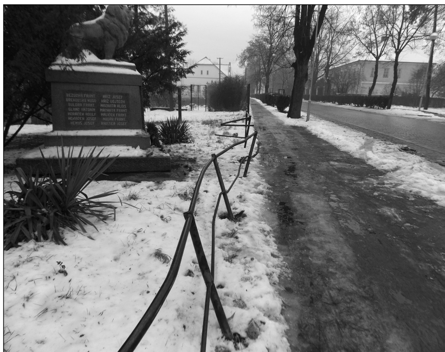
Poškozené zábradlí už je opravené.