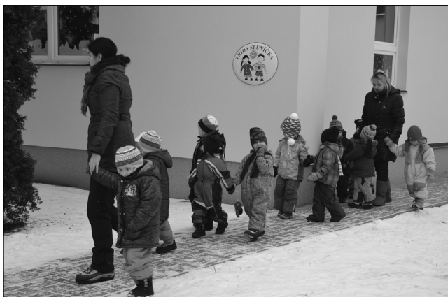
Děti z nového pavilonu.